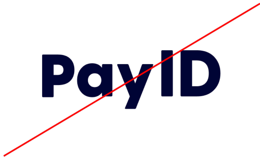
モノグラム無しで使用しない