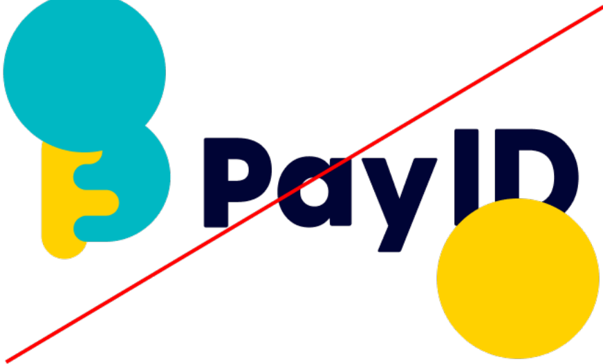
オブジェクトを重ねない