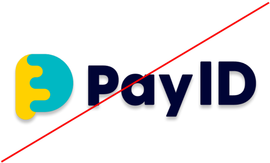
無関係な効果を追加しない