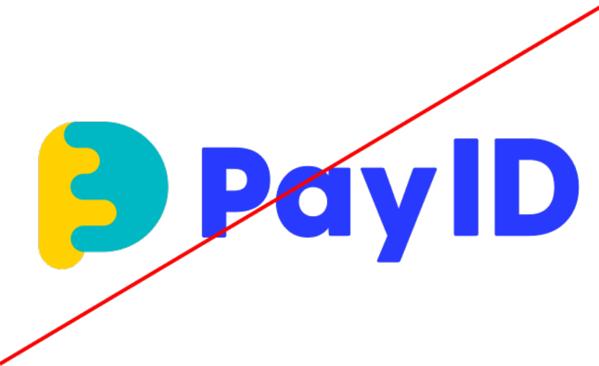
色を変更して使用しない