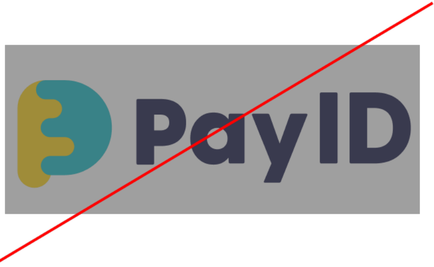
フィルターや効果を使用しない